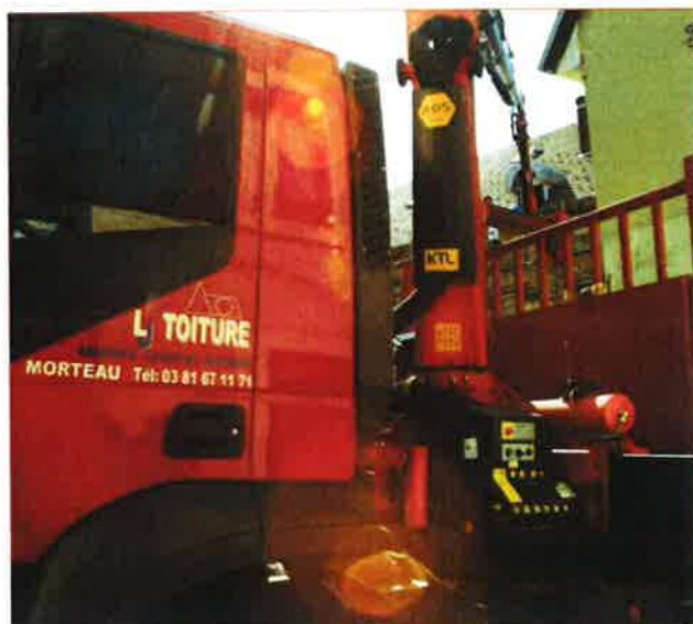
L.J. Toiture est habituée à des travaux techniques. Ici la rénovation de la charpente de l'hôtel La Guimbarde.

Spécialisée dans tous les types d'installation de chauffage et de plomberie pour les particuliers comme pour les entreprises, elle diversifie son activité avec ce nouvel emploi. "La personne que nous venons de recruter est un électricien. Il effectue évidemment les travaux d'électricité générale d'une habitation, mais également le branchement de nos installations de chauffage" ajoute l'entrepreneur qui a tous les agréments pour poser les équipements Steibel Eltron, une marque de référence dans le domaine du chauffage sanitaire et des énergies renouvelables. ■