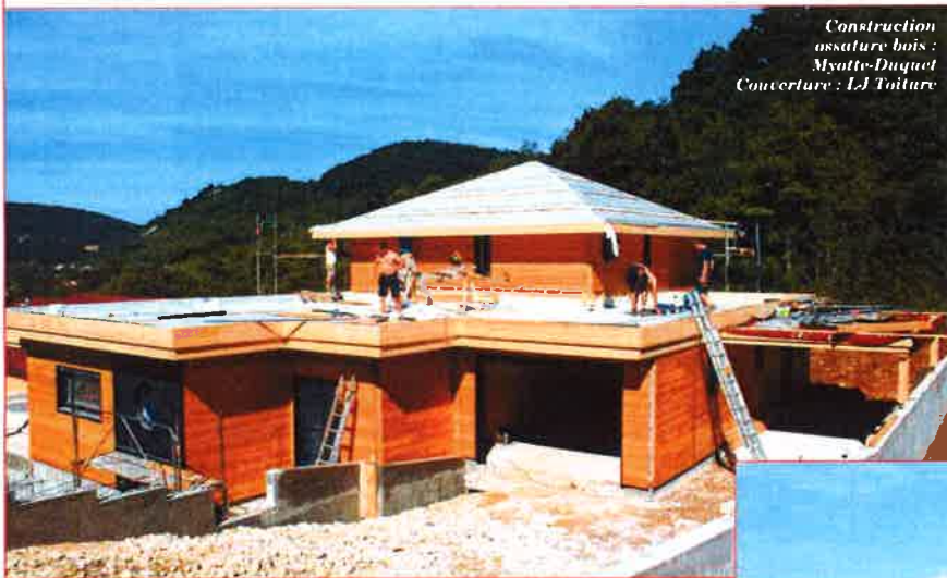
Construction ossature bois : Myotte-Duquet Couverture : LJ Toiture

Toiture en cuivre, zinc, inox, avec terrasse végétalisée.