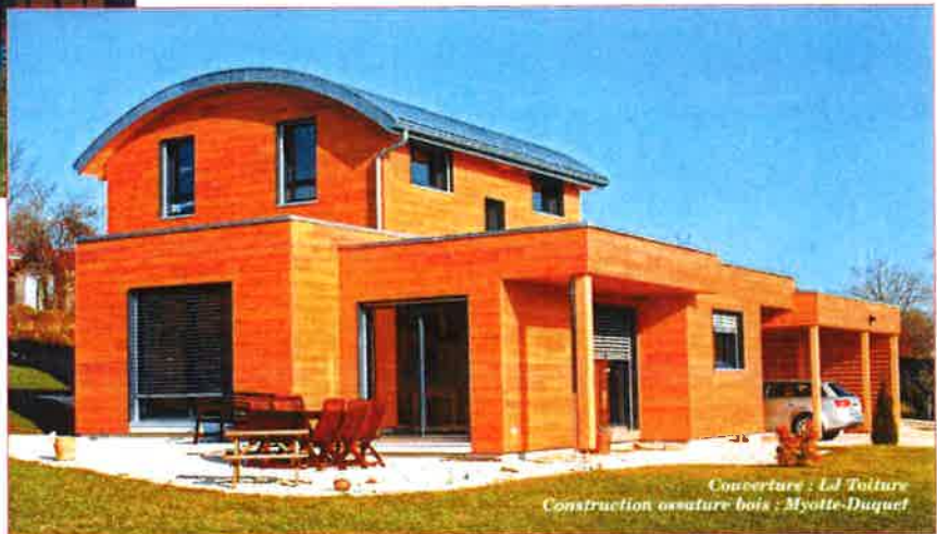
Couverture : LJ Toiture Construction ossature bois : Myotte-Duquet

Pour de plus amples renseignements, n'hésitez pas à contacter LJ Toiture qui vous présentera ses réalisations en toitures métalliques à joint debout. ●